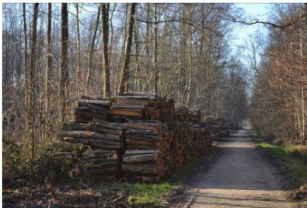
Le bois est entreposé en bord de chemin