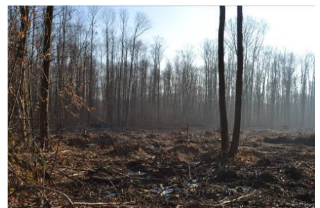
La parcelle 122 après la coupe d'un hectare de 2014

Une coupe d'amélioration est prévue sur le reste de la parcelle. Cette intervention consiste à éclaircir le peuplement en exploitant les arbres moins bien conformés.