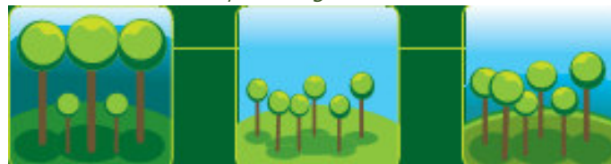
Une forêt d'arbres vieillissants