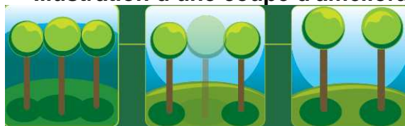
Illustration d'une coupe d'amélioration

Composée essentiellement de châtaigniers, chênes et de hêtres la forêt continuera de grandir dans les meilleures conditions.